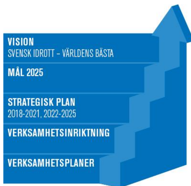
Figur 2: Bilden beskriver hur idrottsrörelsens vision, mål och strategiska plan hänger samman med RF:s och SISU:s verksamhetsinriktning och verksamhetsplaner.